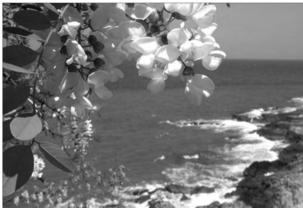
Символи міста — акації та море.

«Дунайський оселедець — це щось неймовірне: масло, ніжність та м'якість. І відсутність «оселедчатого» запаху. Єдина