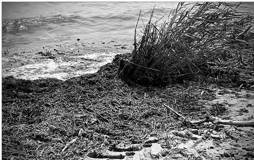
Такий вигляд мало узбережжя Одеси після підриву Каховської ГЕС.