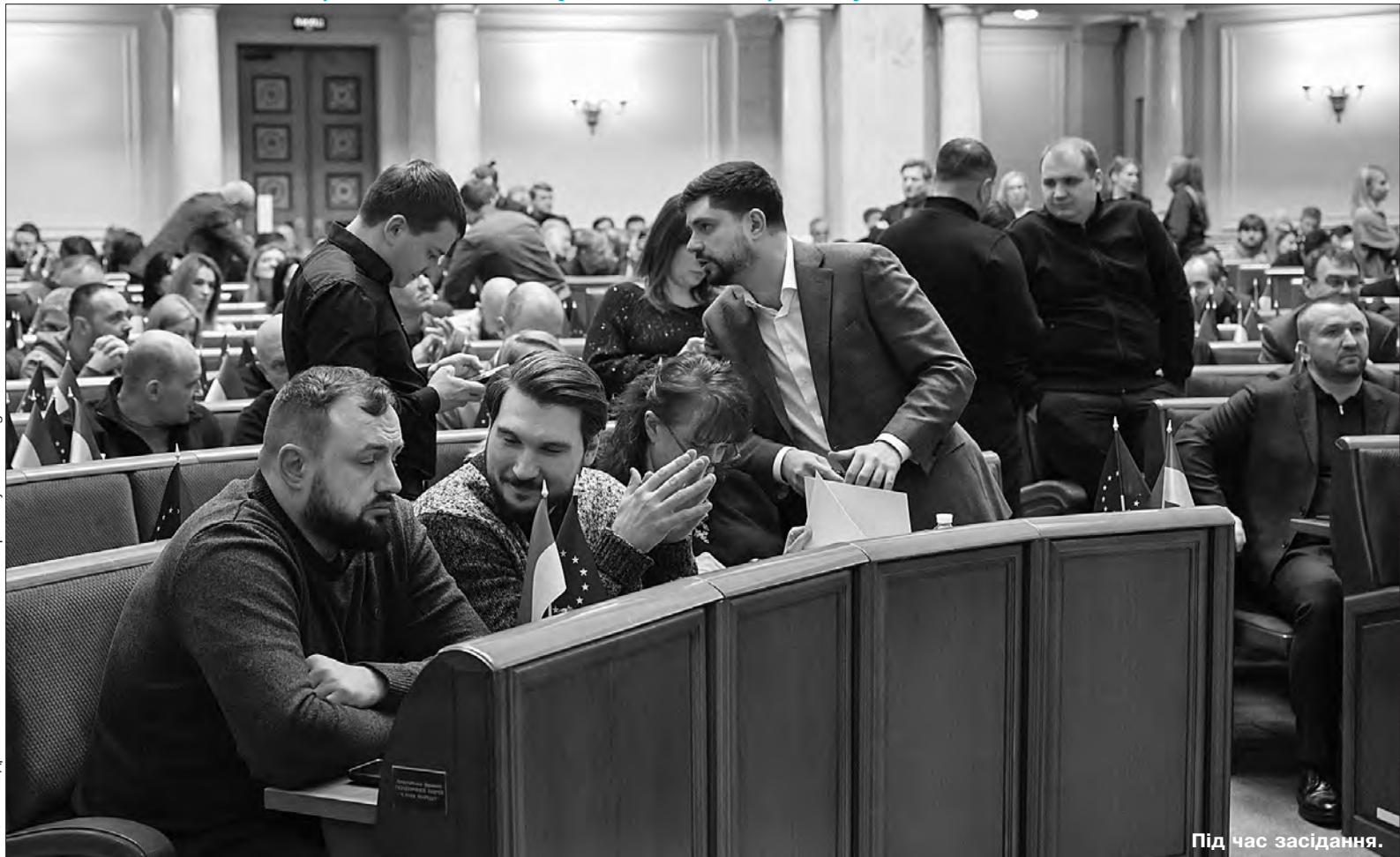
Фото Андрія НЕСТЕРЕНКА. Більше фото тут — www.golos.com.ua

Міністри закордонних справ 47 країн засудили експорт Корейською Народно-Демократичною Республікою (КНДР) та закупівлю росією балістичних ракет, а також їх застосування проти України 30 грудня 2023 року та 2 січня 2024-го. Відповідний документ днями оприлюднило Міністерство закордонних справ України. ▶ СТОР. 6