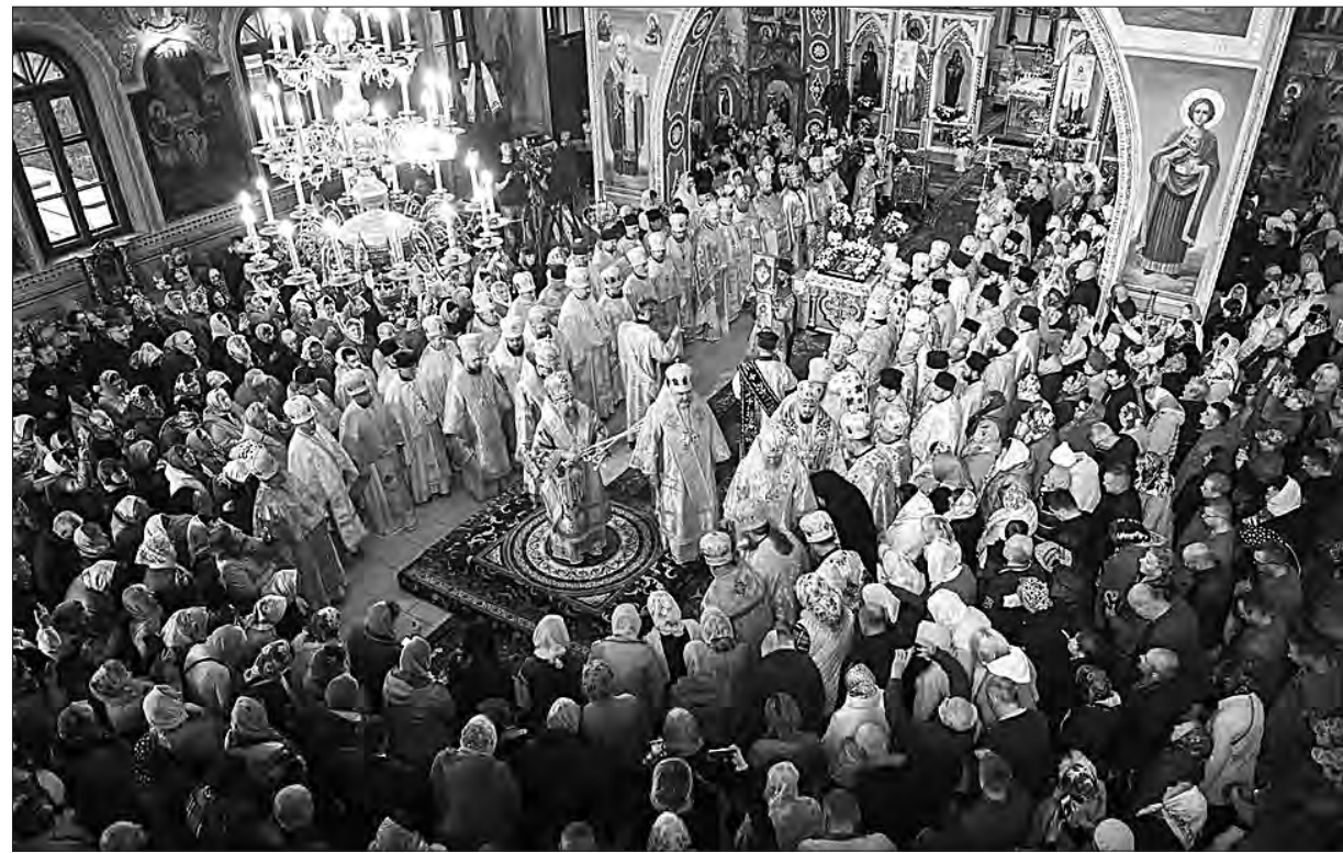
Торік, відвідавши Хмельниччину, митрополит Епіфаній очолив урочисту Божественну літургію у Свято-Покровському кафедральному соборі, який перейшов у підпорядкування ПЦУ. Він зауважив, що за кількістю парафій Хмельницька єпархія ПЦУ є другою після Київської, і громад, які переходять в її канонічне підпорядкування, поступово стає дедалі більше.