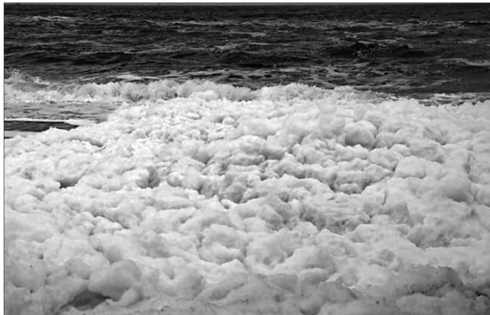
У грудні 2023 року море перетворилося на так зване капучино — один із рідкісних феноменів природи.

Та справжній скарб — у рибному павільйоні «Привозу». На початку березня минулоріч Одесою ширився розголос: