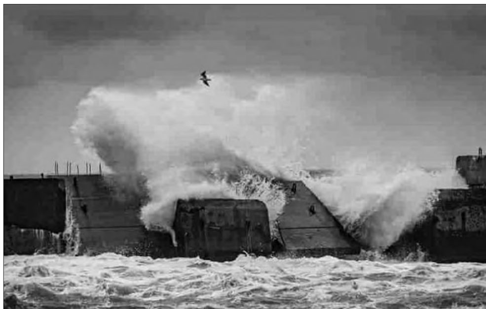
Найбільший за весь рік шторм на морі.

Від Ланжерону до Аркадії з кінця липня відкрилися окремі пляжі. Усе було добре організовано стосовно питань безпеки. Щодня в морі курсував корабель. Коли знаходили небезпечні предмети, забороняли відпо-