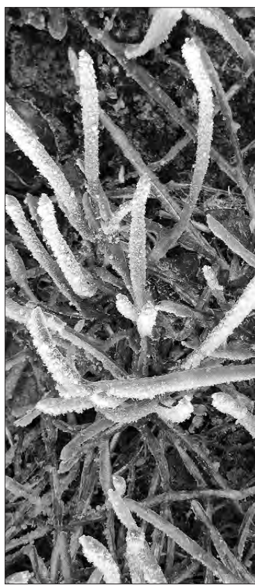
Хоча січень приніс морози та негоду, проте на полях ситуація не критична. Сходи вкриті сніговою ковдрою, тож вимерзання від низьких температур їм не загрожує.