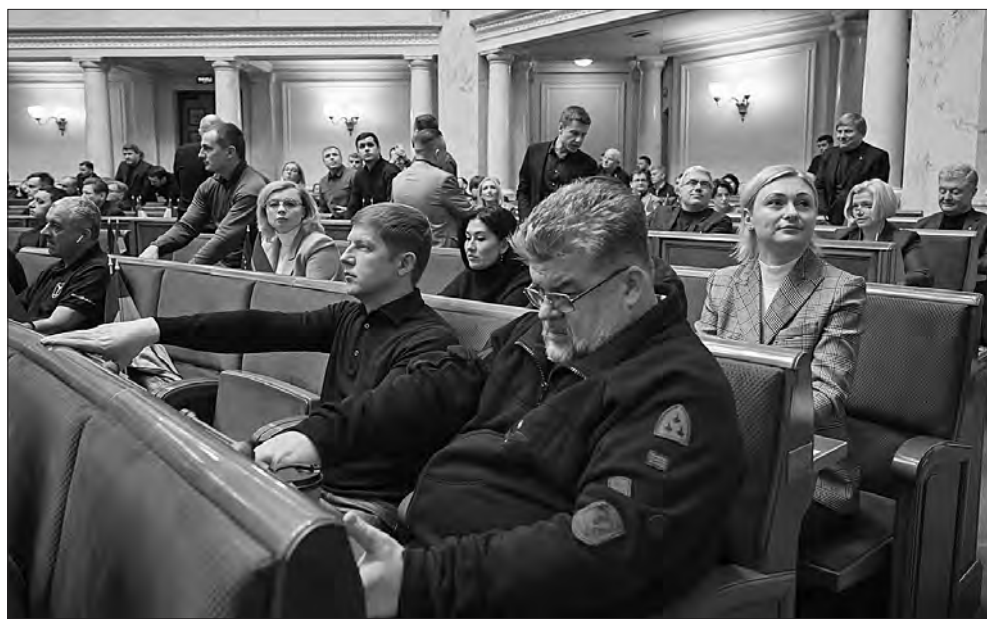
Під час засідання.

Проектом, зокрема, передбачається надання Міноборони повноважень щодо затвердження для сил безпеки і оборони клінічних протоколів, табелів матеріально-технічного оснащення, стандартів надання домедичної та медичної допомоги на до-